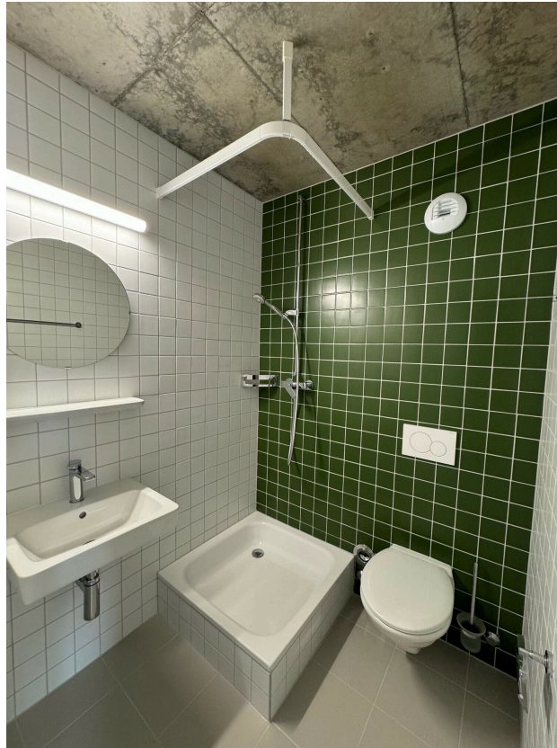
Salle de douche privative