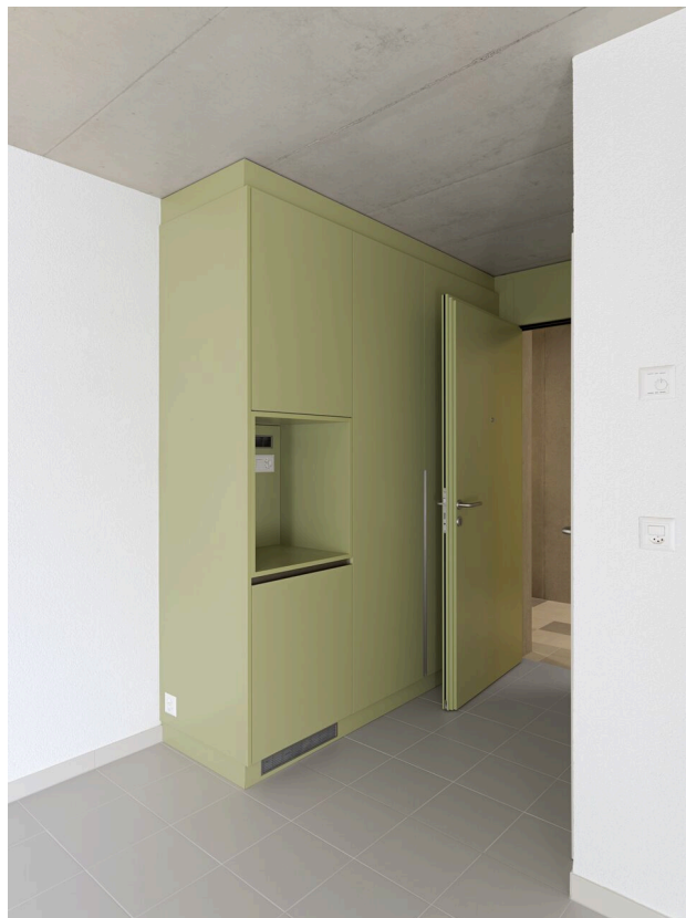
Chambre avec SDD